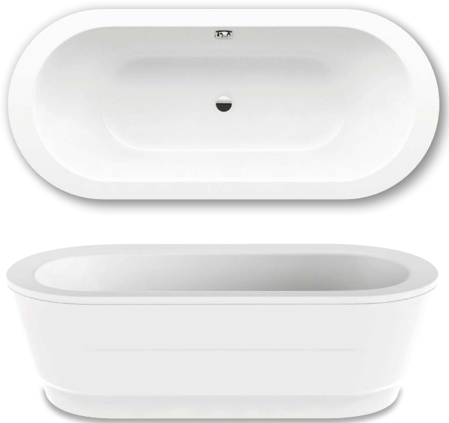
Ilustración similar. Panelado compuesto de PUR especial revestido (poliuretano).

Si desea la bañera con orificios para el asidero a un lado, indique en el pedido la variante xxxx 1011 xxxx.